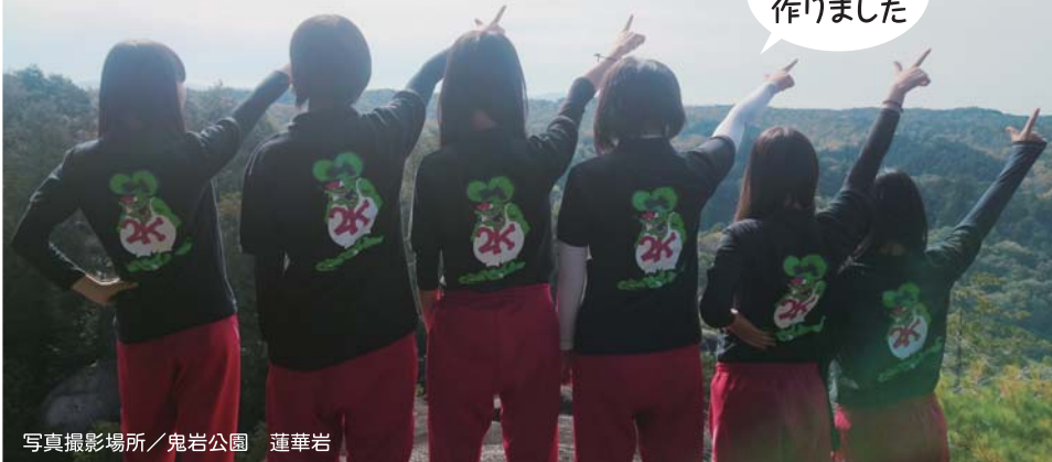
写真撮影場所 / 鬼岩公園 蓮華岩